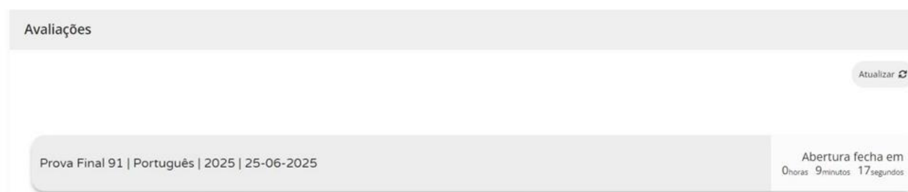
Figura 2 – Acesso à prova a realizar

11.11. Nas provas, ao clicar em “Iniciar sessão”, por exemplo, para um aluno que realiza a prova final de Português (91), aparece o seguinte ecrã: