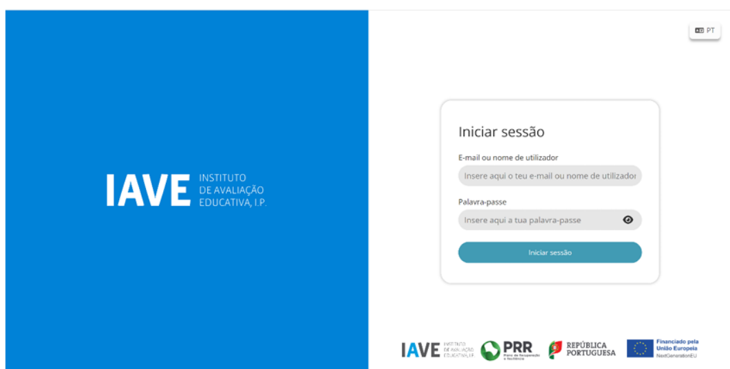
Figura 1 – Acesso à Plataforma de Realização de Provas do IAVE

a) Abrir a aplicação de realização de provas;